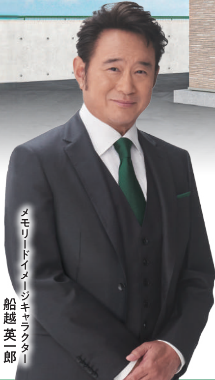
メモリードイメージキャラクター 船越英一郎

2023年12月 高崎箕郷メモリードホール オープンイベント 来館記念抽選会 参加チケット *おひとり様1枚1回限り有効 *コピー不可