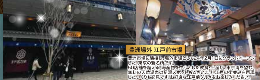
豊洲場外 江戸前市場

豊洲市場に隣接し、場外市場として24年2月1日にグランドオープンした、東京の新名所です。 50店舗を超える、海産物を中心とした飲食・土産店、東京湾を望む、無料の天然温泉の足湯スポットもございます。江戸の街並みを再現したつくりも必見です。お好きな江戸前グルメをお楽しみください。